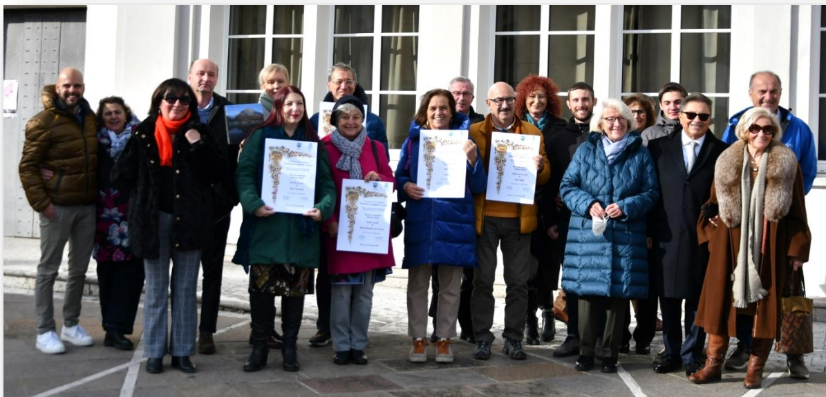
Premiati con Autorità e Collaboratori