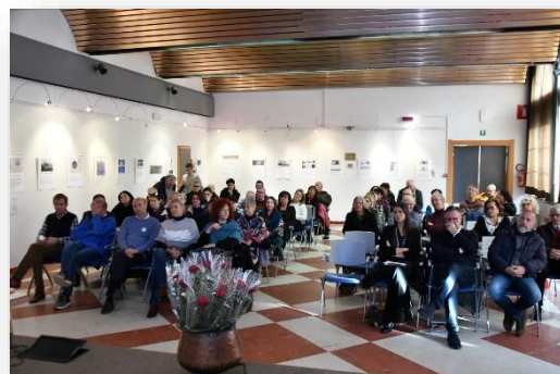
Sala Centro Civico